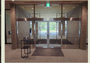
熊本県庁防災センターに設置

電気を使わないので、電気配線工事も資格者も不要。もちろん電気代0円 ユニバーサルデザインにより、バリアフリー。災害対策・SDGs・脱炭素で各施設にて採用