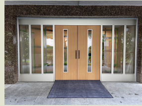
マンション自動ドアの改修