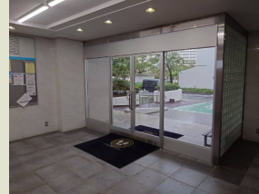
作新学院に6台設置